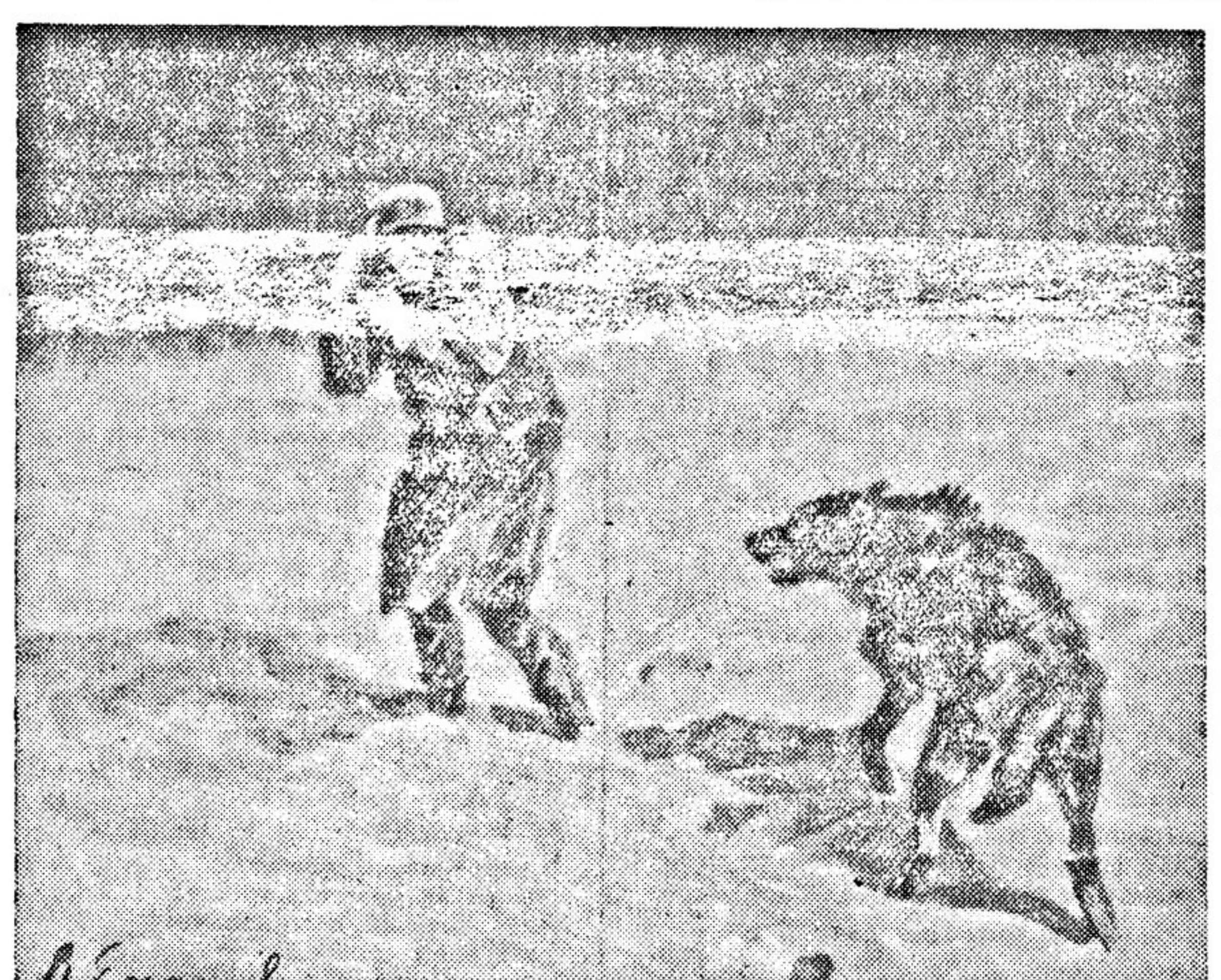
Художественная выставка «Отечественная война» (г. Куйбышев). В. Ефанов. «Хищники» (масло).